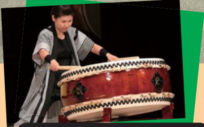
Kyouryu Wadaiko Drummers